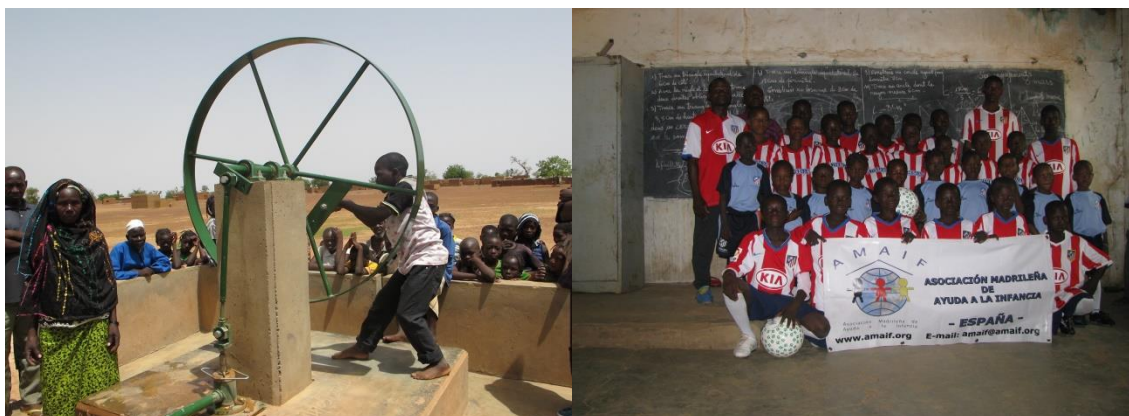
Pozo de Agua en BF.