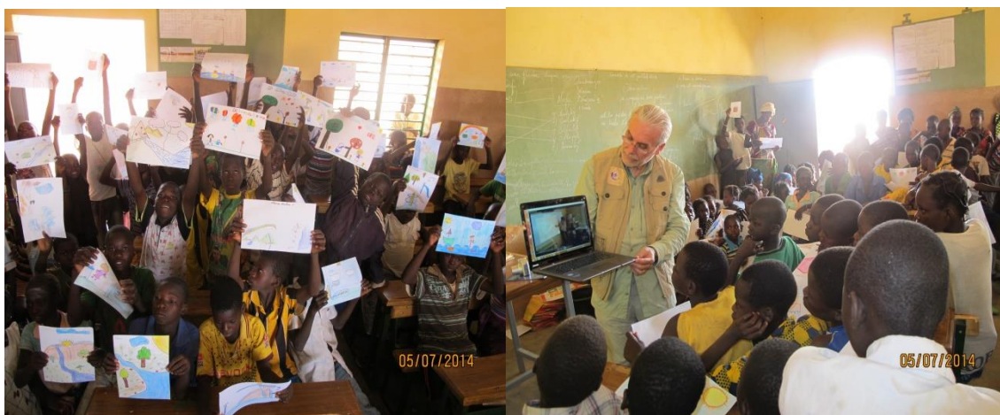
Los Viajes del Agua en la Escuela Dinguiri–Burkina Faso